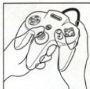
ライトポジション

このゲームでは、図のように2通りのコントローラの握り方(ライトポジションとセンターポジション)をおすすめします。この握り方なら、左手親指で3Dスティック(および十字ボタン)を自由に操作することができ、右手親指でA/BボタンおよびCボタンユニットを使い分けることが可能です。