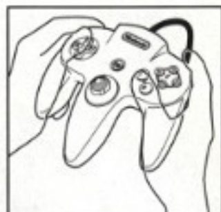
センターポジション